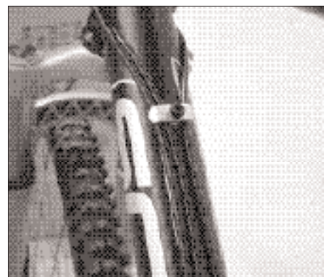
Scott Cable Routing