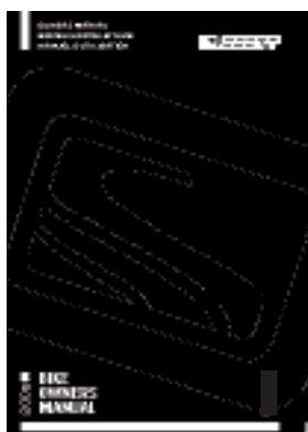
Manuel d'utilisation de l'amortisseur Genius