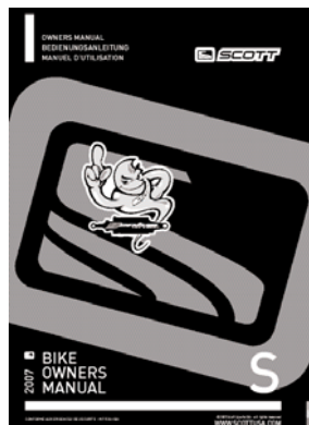
Genius Shock Manual