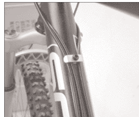
PERCURSO INTELIGENTE DOS CABOS SCOTT