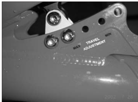
Bohrungen in der Dämpferbefestigung

WICHTIG! Montieren Sie die Rearshocks immer mit dem Ausgleichsbehälter (Piggy Pack), wie rechts abgebildet, in der Position "vorne-oben". Ein Einbau des Dämpfers in anderer Position kann zu schweren Schäden an Rahmen, Hinterbau oder Dämpfer führen!