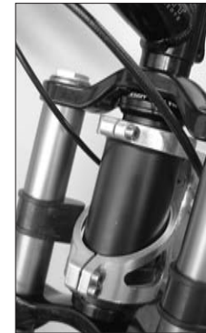
Headtube High Octane 1 1/8"