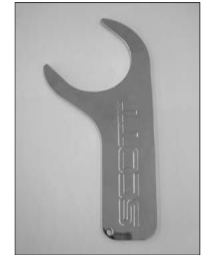
Drehmomentschlüssel mit 4mm Inbusaufsatz