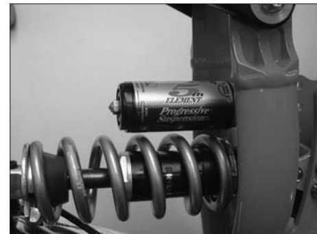
Rearshocks in Position «vorne-oben»

WICHTIG! Montieren Sie die Rearshocks immer mit dem Ausgleichsbehälter (Piggy Pack), wie rechts abgebildet, in der Position "vorne-oben". Ein Einbau des Dämpfers in anderer Position kann zu schweren Schäden an Rahmen, Hinterbau oder Dämpfer führen!