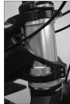
Headtube High Octane 1.5"