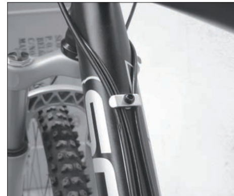
Smart Cable Routing