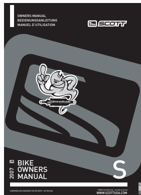
Genius Shock Manual