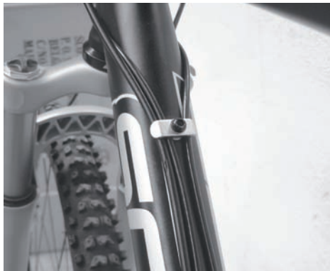
Smart Cable Routing